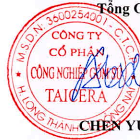
CHEN YUAN MING